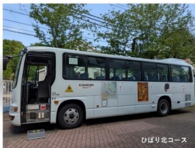
東京都アートプロジェクト展入選作品が描かれています